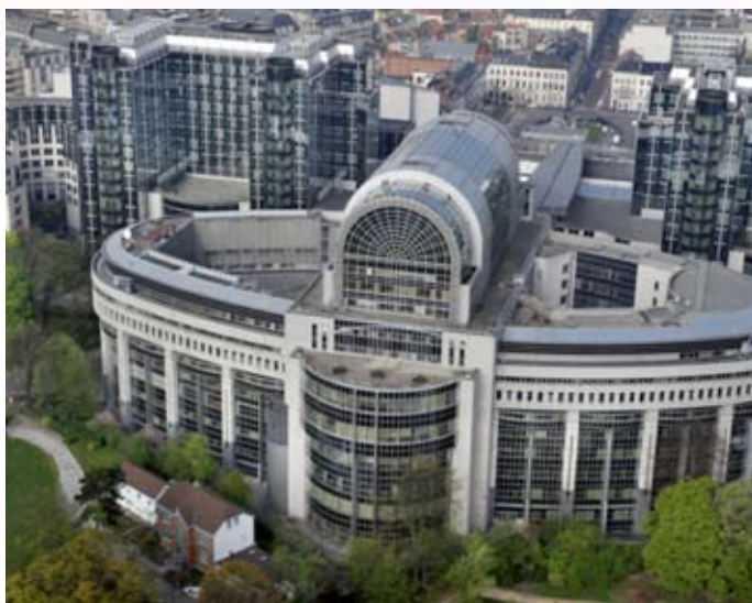
Le Parlement européen à Bruxelles

Citoyens européens, à vos urnes le 25 mai!